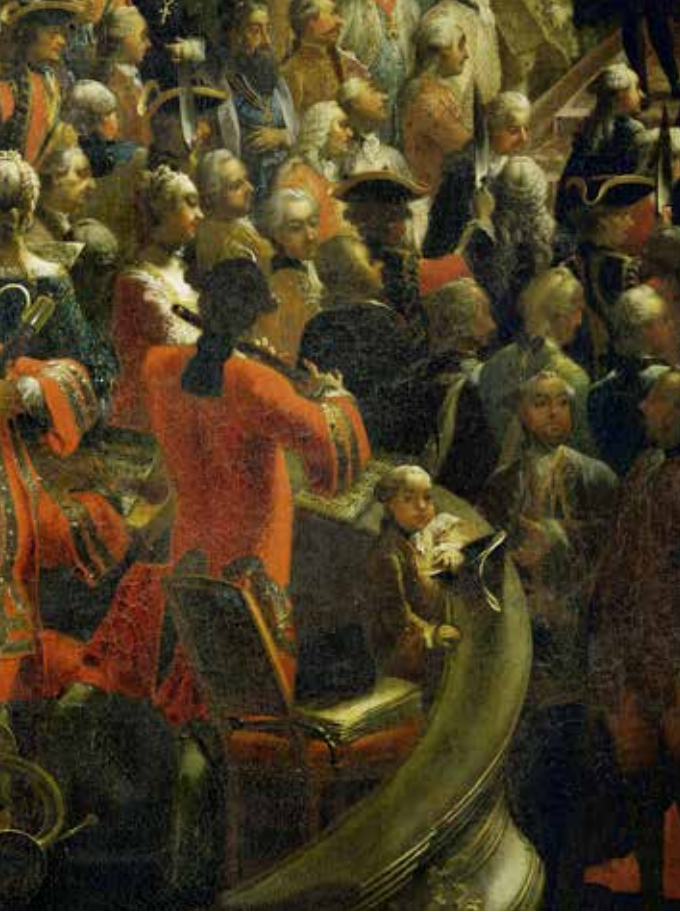
Seit frühester Kindheit mit höfischen Gepflogenheiten vertraut: der vierjährige Mozart beim Diner zur Hochzeit Josephs II. mit Isabella von Parma in der Wiener Hofburg am 10. Oktober 1760. Ausschnitt aus einem Gemälde von Martin van Meyens (1763).

„Affekten“ verstand – und die einem als pathetische Gefühle etwa bei Beethoven, Tschaiowsky und Mahler wiederbegegnen – galten im Rokoko als unkultiviert. Die Aufklärung mit ihrem Interesse an Psychologie entdeckt die Affektmischungen: dass man, während man wie neben sich steht, zugleich glücklich und traurig oder großzügig und neidisch sein kann. Wenn also die Königin der Nacht aus Mozarts Oper „Die Zauberlölte“ in schwarzem d-Moll der Hölle Rache beschwört, zeichnet sie diese Eindeutigkeit als eine im Kern noch barocke Figur, eine „altmodische Person“ aus: die alte, boshafte Tante eben. Ein „moderner“ Rokoko-Mensch ließe sich niemals so gehen.