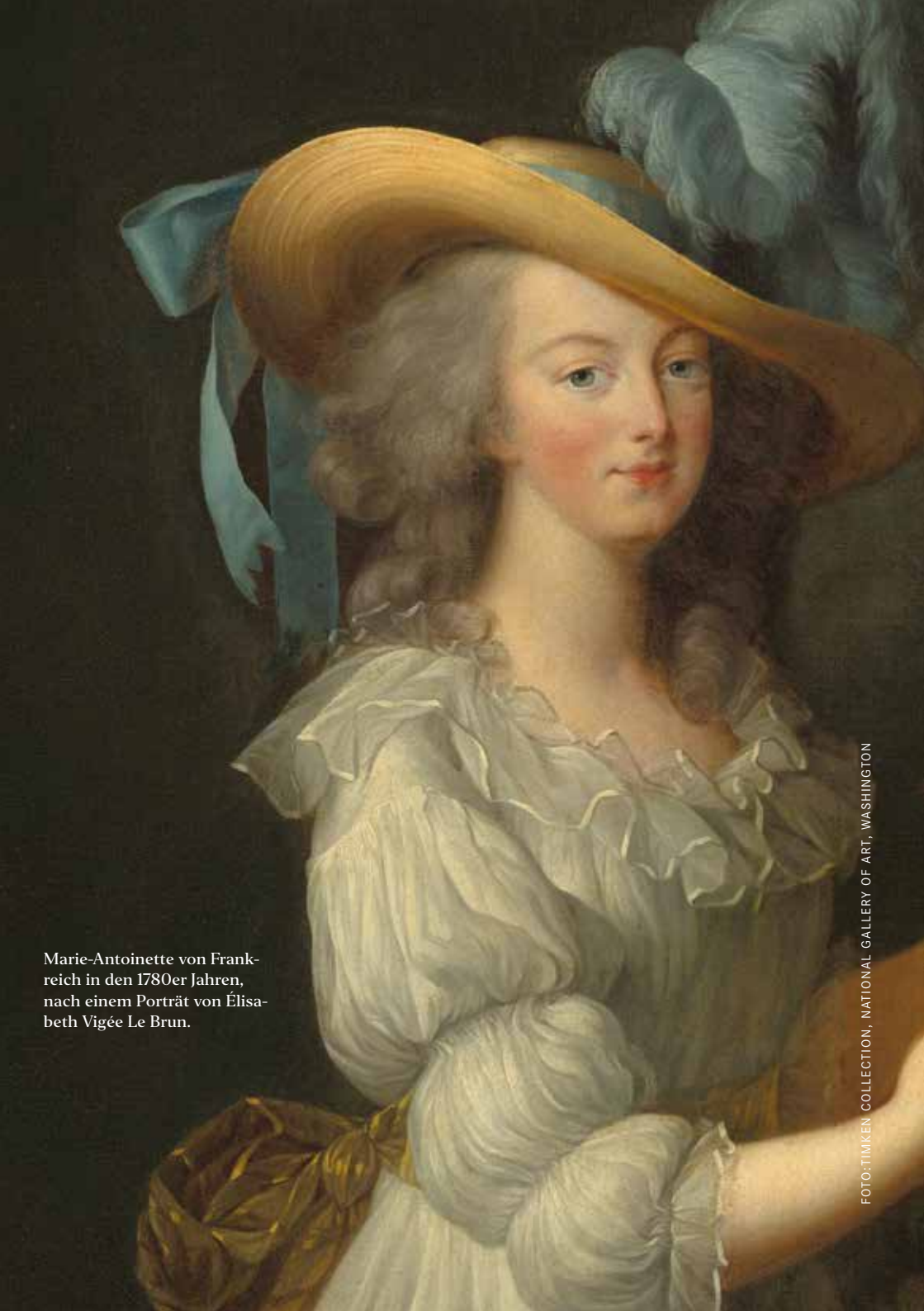
Marie-Antoinette von Frankreich in den 1780er Jahren, nach einem Porträt von Élisabeth Vigée Le Brun.